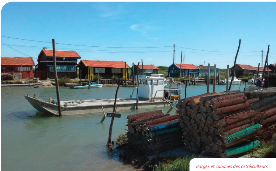
Barges et cabanes des ostréiculteurs

Au programme, la Charente-Maritime, découverte de villages classés, les cabanes des ostréiculteurs, l'île d'Oléron, la ville de Royan, etc. et bien-sûr, pour nos randonneurs, des parcours atypiques.