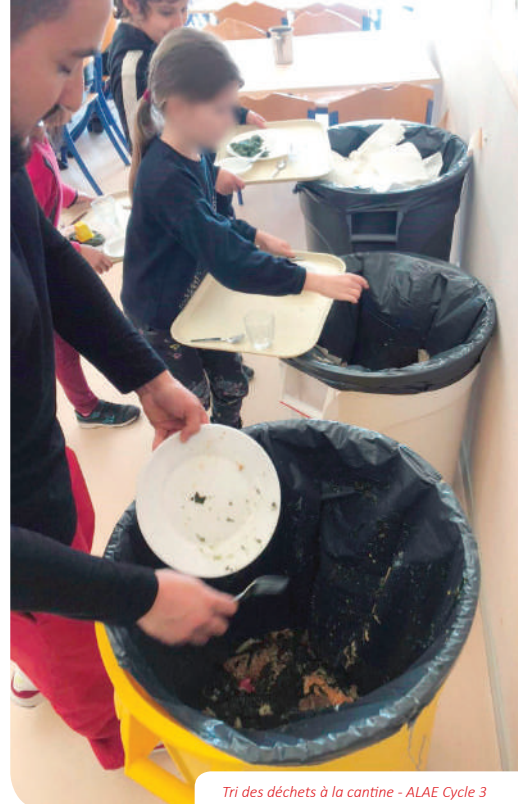
Tri des déchets à la cantine - ALAE Cycle 3