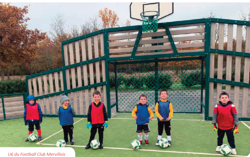
U6 du Football Club Mervillois

Vous avez dû voir ou entendre passer des sportifs dans le village le mardi et le jeudi soir. Merville trail ? Non, c'était les séniors du FC Merville ! En effet, depuis mi-novembre et suite aux intempéries, les terrains de Merville et de Daux ont été souvent impraticables. Les matchs à domicile ont été annulés et des entraînements alternatifs ont dû être organisés : footing, foot en salle, tableau noir, utilisation de l'aire de jeu, etc. Tous ces contretemps ne sont pas sans effet : retard dans la progression des petits et baisse des résultats des seniors. Il ne reste plus qu'à espérer le retour du beau temps pour reprendre un fonctionnement normal.