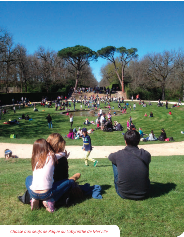
Chasse aux œufs de Pâque au Labyrinthe de Merville