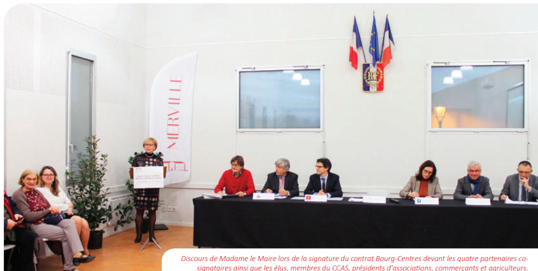
Discours de Madame le Maire lors de la signature du contrat Bourg-Centres devant les quatre partenaires co-signataires ainsi que les élus, membres du CCAS, présidents d'associations, commerçants et agriculteurs.

Si vous souhaitez consulter le contrat, rendez-vous sur le site de la commune : www.merville31.fr