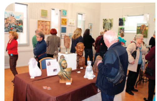
Festival des arts 2019

Likez la page Facebook de la commune "Ville de Merville 31" et suivez toutes les actualités de Merville en temps réel. De nombreuses informations pratiques et événementielles vous seront communiquées !