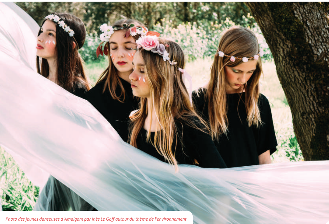
Photo des jeunes danseuses d'Amalgam par Inès Le Goff autour du thème de l'environnement