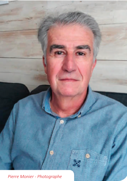
Pierre Monier - Photographe

Du 4 au 29 mai 2020, le hall de l'Hôtel de Ville de Merville accueillera, dans le cadre du Festival IBO "Mai Photographique"*, une exposition de Pierre Monié, photographe amateur éclairé.