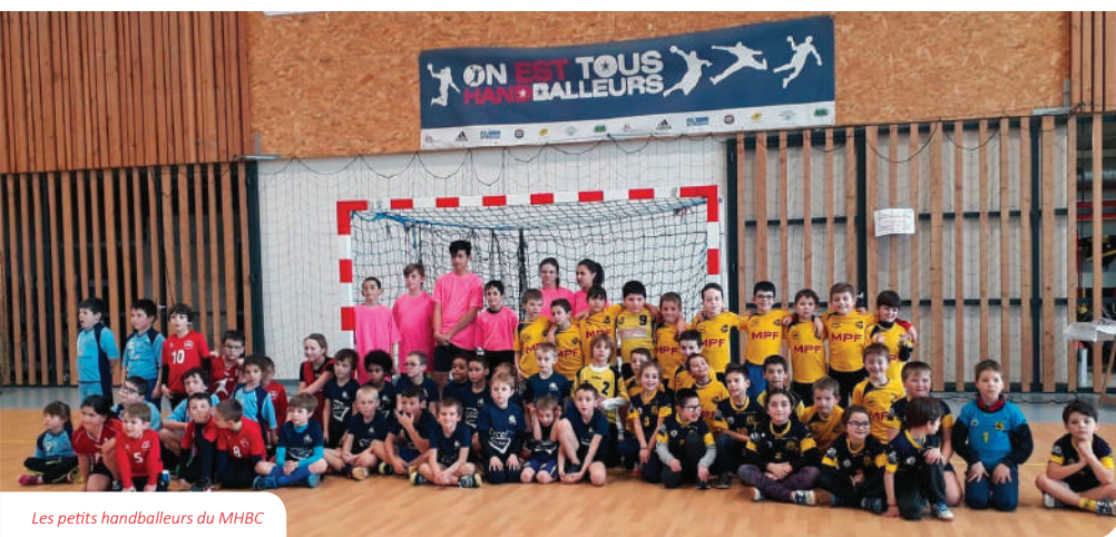
Les petits handballeurs du MHBC

2020, année phare pour le MHBC : c'est l'année des 20 ans du club ! Vingt ans de rencontres humaines et sportives, de solidarité, d'amitié, de passion pour le handball.