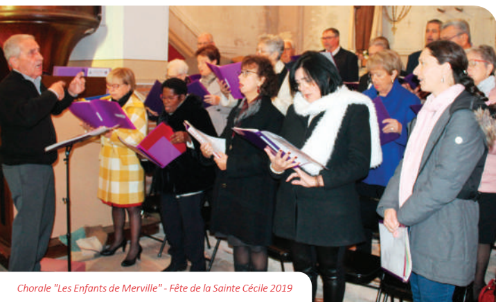
Chorale "Les Enfants de Merville" - Fête de la Sainte Cécile 2019

Notre association a eu une année bien remplie. Elle est intervenue plus de 24 fois dans la vie de notre ville : grandes fêtes religieuses, mariages, enterrements, Fête de Merville, pèlerinage à N.D. de Livron, goûter des enfants des écoles, etc.