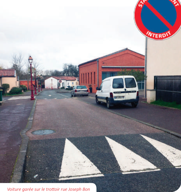
Voiture garée sur le trottoir rue Joseph Bon

L'article R 417-11 du Code de la Route prévoit que le stationnement des véhicules sur les trottoirs constitue une infraction réprimée par une contravention de 4 ème classe.