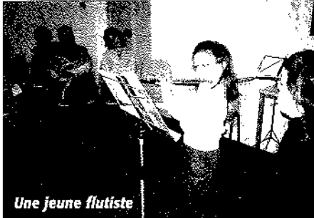
Une jeune flutiste

Tous les élèves ont joué devant un public nombreux et ravi.