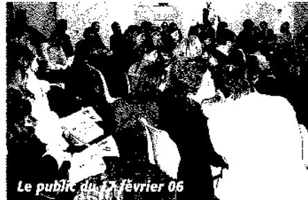
Le public du 17 février 06