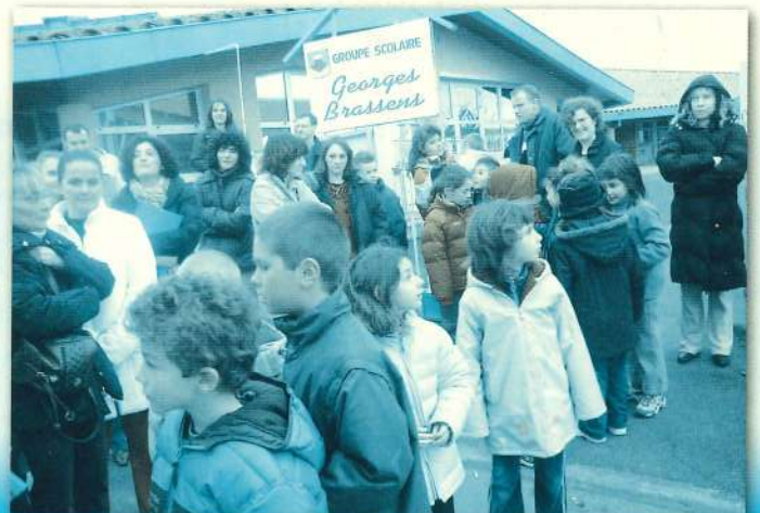
La classe transplantée