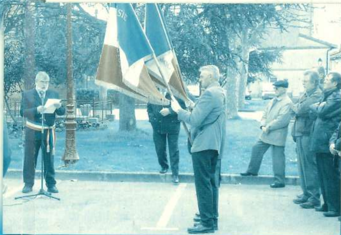
Cérémonie commémorative du 19 mars